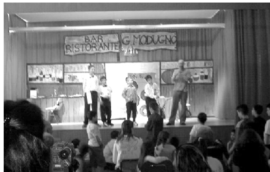
Un momento della rappresentazione messa in scena dagli alunni della «Modugno» di Barletta